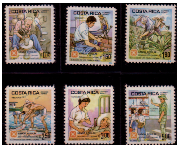
Figura 5: Serie homenaje a trabajadores (1981).

En la serie, aparecen homenajeados 5 oficios socialmente atribuidos a hombres: el de pescador, agricultor, policía rural, peón de construcción y alfarero. Junto a ellos, aparece una mujer enfermera cuyo ejercicio, a pesar de constituir una profesión, hay que recordar que la primera escuela de enfermería en Costa Rica se remonta a 1899, pareciera presentarse en clave de oficio. Luego presentando a la enfermera en compañía de oficios no cualificados, de trabajos empíricos y artesanos, la serie de estampillas a pesar de procurar el homenaje a la enfermería, fortalece la falta de reconocimiento profesional para una disciplina cuyo ejercicio requería para esa época de estudios universitarios. Reconociendo los saberes y destrezas de los oficios retratados, muy diferente habría sido si la enfermera estuviera acompañada en la serie de abogados, ingenieros o arquitectos, profesiones que junto a la del médico, parecieran gozar de un reconocimiento social por lo menos, diferente. La serie en última instancia, también evidencia la diferenciación de roles que se espera para cada género.