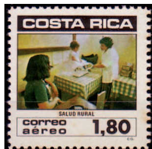
Figura número 7: La salud rural como progreso nacional (1982).

denominado proceso de modernización del sector salud. Paradójicamente, en el mismo instante en el que se reconoce la labor de la enfermería como agente de construcción comunitaria de la salud, se inicia el proceso de modernización que da como resultado la eliminación de los programas de atención comunitaria que desarrollaban las profesionales de enfermería, limitando su escenario de trabajo paulatinamente al ambiente hospitalario intramuros.