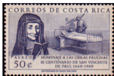
Figuras 1- 4: Por orden de aparición. Hermanas de la Caridad (1960,) Homenaje a las Organizaciones de las Naciones Unidas (1961), Congreso de Pediatría (1976) y Homenaje a la enfermería (1981).

Analizadas individualmente, destaca de la segunda figura el protagonismo de la enfermera para homenajear a la Organización Mundial de la Salud. En dicha estampilla, la enfermera aparece en los dos dibujos presentes: en uno tomando la temperatura al paciente encamado y en el otro asistiendo al médico en la acción de administrar medicamentos intramuscularmente, por el ángulo de aplicación – 90°, mediante una jeringuilla. En el procedimiento de administrar medicamentos, si bien en la actualidad forma parte del quehacer profesional de la enfermera, la enfermera se presenta como un acompañante del paciente y con una función de asistencia hacia el médico, circunstancia que fortalece el mito de que la enfermera no es más que la ayudante del médico: profesional varón jerárquicamente superior y con mayores conocimientos. Esto es, la enfermera aparece acompañando al paciente y tomándole la temperatura, acciones de menor complejidad, mientras que el médico aparece administrando medicamentos, acción en apariencia y para el imaginario social de mayor complejidad.