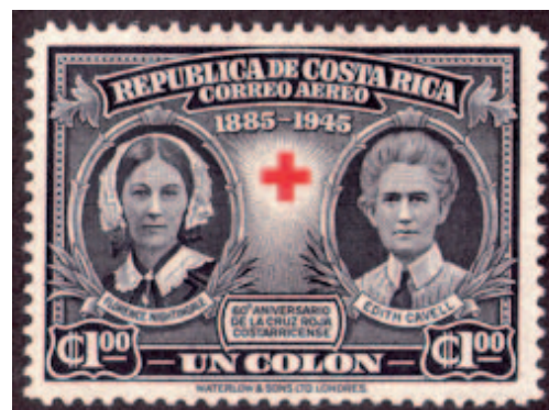
Figura 6: Estampilla conmemorativa del 60 aniversario de la Cruz Roja Costarricense (1945).

La estampilla emitida para conmemorar el 60 aniversario de la Cruz Roja, presenta un diseño que podría definirse a partir de las ilustraciones propias de la numismática. En este caso concreto, la estampilla, con el diseño tradicional de un billete (retratos centrados y enmarcados y el precio del billete en forma protagónica), retrata la figura de dos enfermeras de reconocido prestigio: Florence Nightingale y Edith Cavell. El retrato “en la moneda y en los sellos postales cobra una relevancia política e ideológica de primer orden, al ser reproducido en forma seriada mediante fundición, acuñado o impresión”. (Hidalgo. 2009. p. 17)